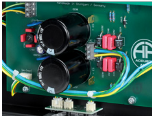
Eine Hälfte der stattlichen, kanalgetrennten Spannungsversorgung. Alle Gleichrichterdioden sind mit Kondensatoren gebrückt